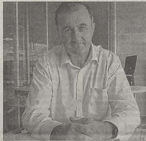
« Les bus doivent continuer à emmener les gens au centre-ville rapidement », lance M. Samman, président de "JMLE17".